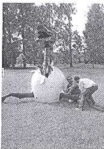
Douze peintres, six sculpteurs venus de toute la Bretagne, mais aussi des conteurs, des musiciens, des chanteurs, participent à la 3 e Ronde des artistes, les 2 et 3 juin.